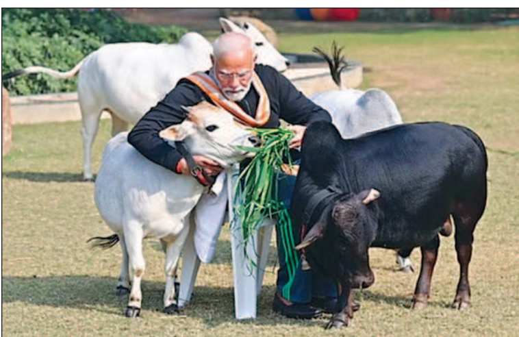
मकर संक्रांति के अवसर पर प्रधानमंत्री नरेंद्र ने अपने आवास पर गायों को चारा खिलाया।

पोंगल के पवित्र दिन तमिलनाडु के हर घर से पोंगल धारा का प्रवाह होता है। मेरी कामना है उसी तरह आपके जीवन में भी सुख, समृद्धि और संतोष की धारा का प्रवाह निरंतर होता रहे। कल ही देश ने लोहड़ी का पर्व धूमधाम से मनाया है। कुछ लोग आज मकर संक्रांति-उत्तरायण मना रहे हैं, कुछ लोग शायद कल मनाएंगे। माघ बिहू भी बस आने ही वाला है। मैं इन सभी पर्वों की सभी देशवासियों को बहुत-बहुत बधाई देता हूँ, शुभकामनाएं देता हूँ। केंद्रीय मंत्री एल. मुरगन